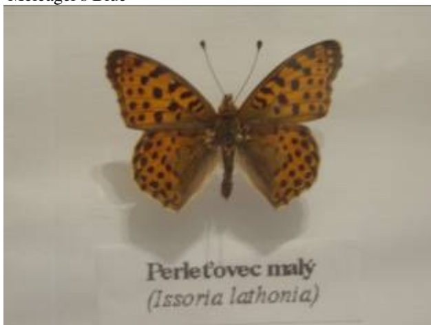
Perletovec malý ( Issoria lathonia )