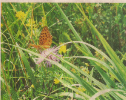
RAJ. Ždánická louka přitahuje motýly i brouky.

„Objevili jsme tady také vzácného denního motýla modráška bořcového. Tento druh dokáže žít pouze na hořci a ten se už v přírodě vyskytuje jen velmi vzácně,“ poukázal entomolog. Ke svému vývoji využívá mraveniště, kde přežívají jeho housenky. „V Motýlí ráji žije také chráněná vřetenuška a řada chráněných utulárků.