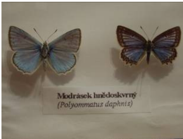
Modrásek hnědoskvrný ( Polyommatus daphnis )